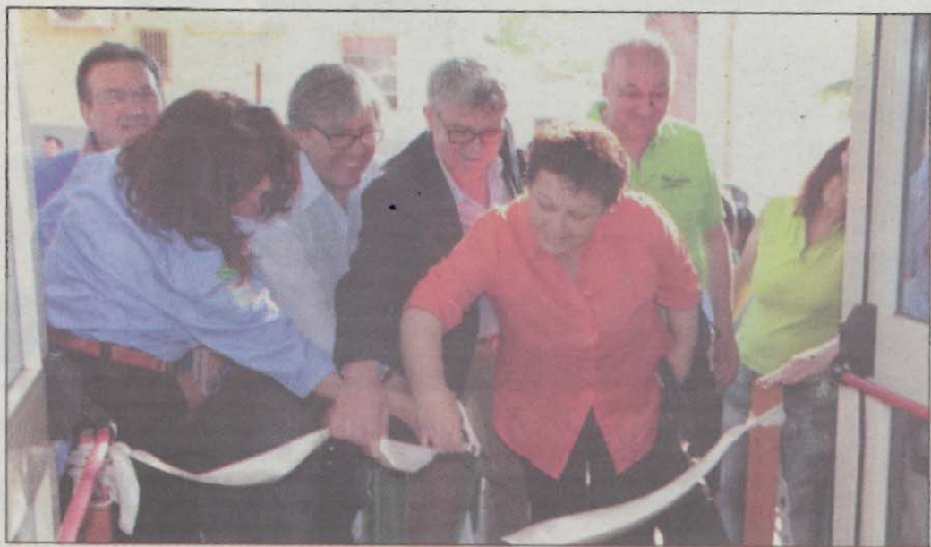
Il taglio del nastro